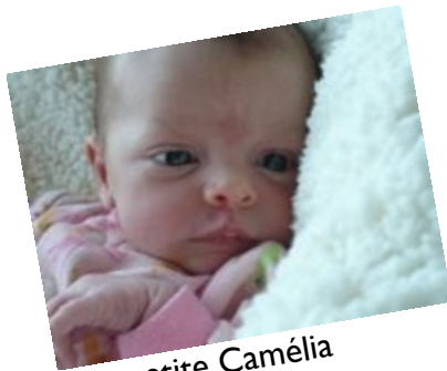
La petite Camélia